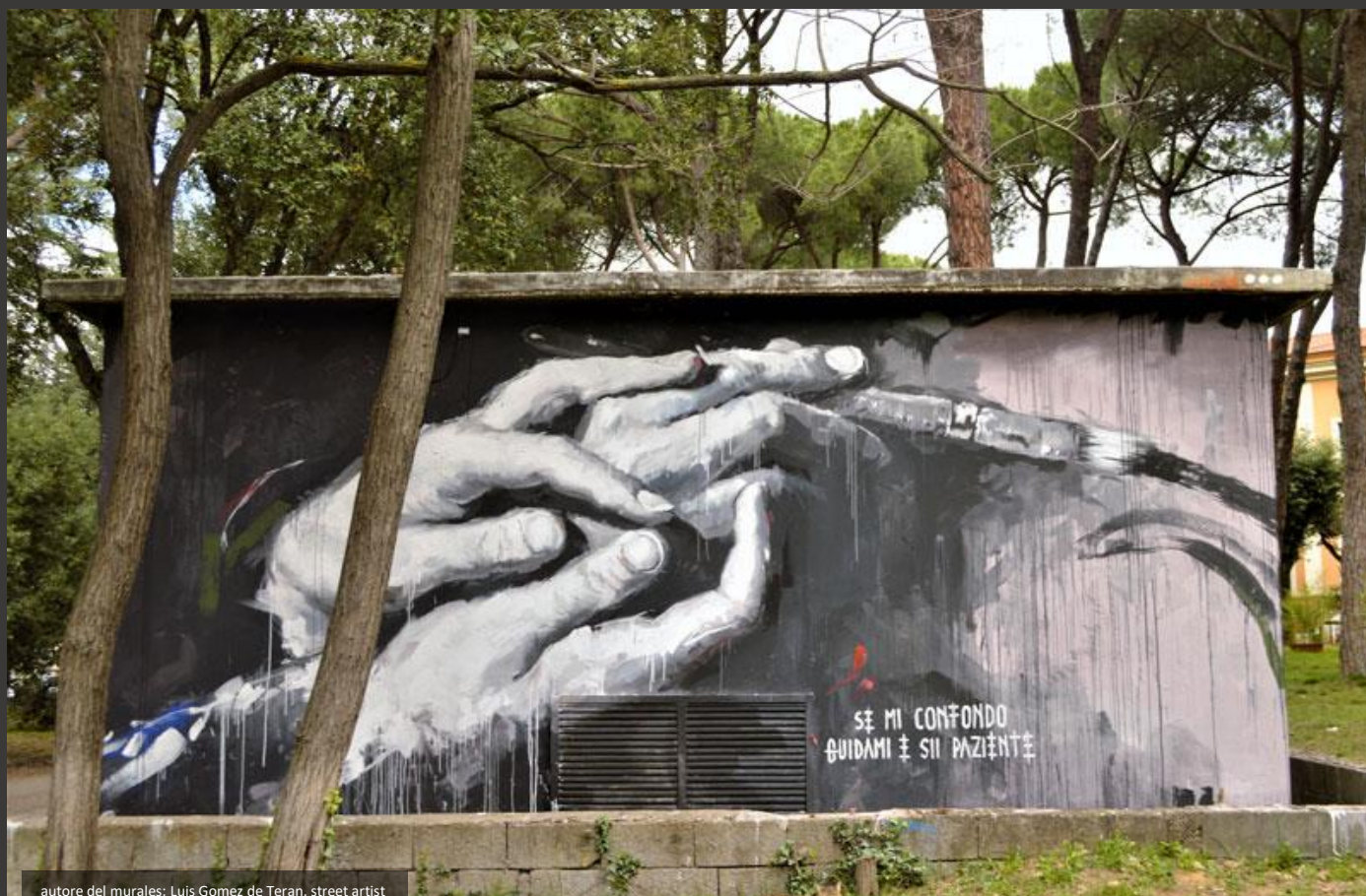
autore del murales: Luis Gomez de Teran, street artist

L'idea di fondo da parte di ISPS Italia è di promuovere una specie di censimento di tutte le realtà terapeutiche che fondano il proprio intervento sulla integrazione dei trattamenti psicologici e sociali nei confronti della psicosi, nelle sue varie forme.